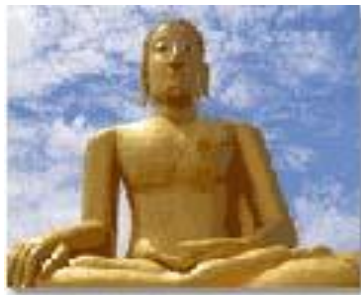
พระใหญ่บนภูเขา สร้างเมื่อ พ.ศ.2541