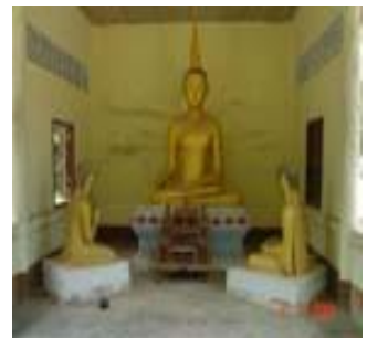
พระพุทธรูปในศาลาล้างเดิมของวัดหน้าเขา