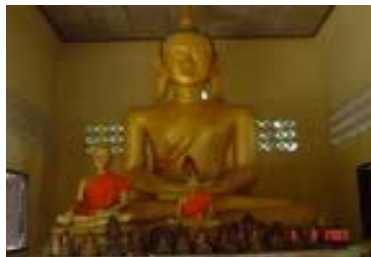
พระประธานในอุโบสถหลังเก่า