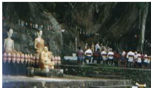
ถ้ำใหญ่บริเวณลานวัฒนธรรม เขิงเขาพระ