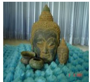
เศียรพระโบราณ พบบนยอดเขา